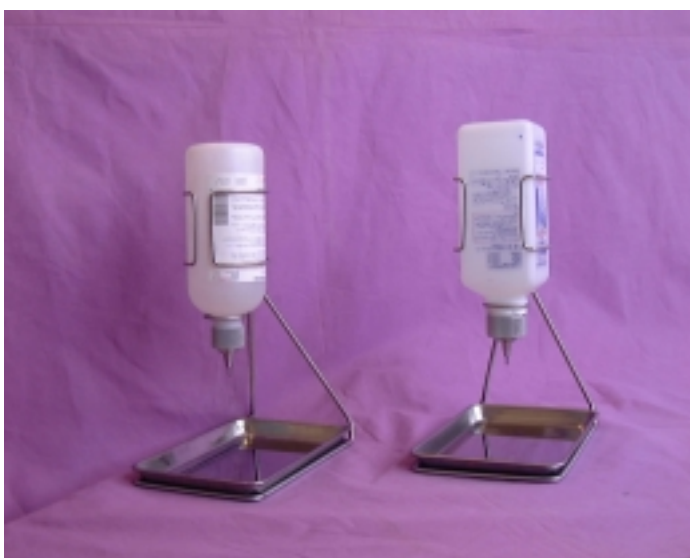
据置型（ステンレストレイ型）

容器保持具等多様な取り付け部品(機種別/別売品)を使用することで、テーブルの側面、ベッドの縦・横のパイプ等あらゆる所に取り付けることが可能です。